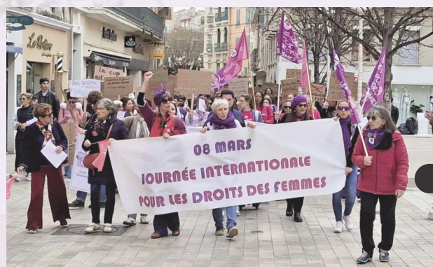
Toulon, le 8 mars 2026